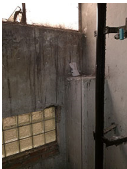
Vrch stávajících betonových pilířů