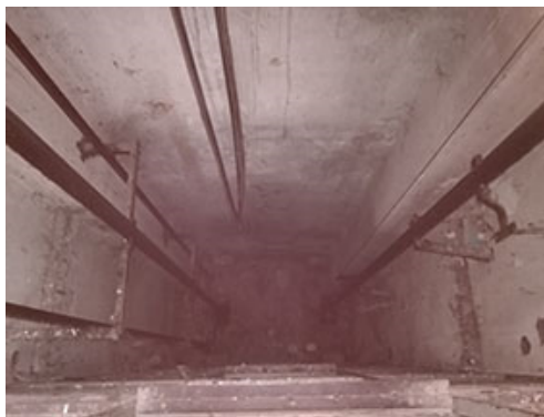
Dno výtahové šachty